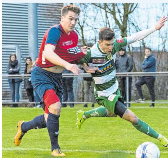
Der SC Cham will auf dem heimischen Eizmoos wieder ihre Heimstärke unter Beweis stellen.