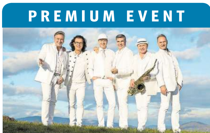
Sie sind bekannt für ihre einzigartige Bühnenshow: die Paldauer.

Samstag, 14. April, um 20 Uhr in der Maienmatt in Oberägeri zum Jahreskonzert. Das Programm dreht sich um Berge und Drachen. Die Musikanten wollen das Publikum mit mystischen Klängen verzaubern. ar